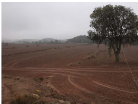
Figura 6.7. Conreus i bancalaments al sud de Cobeils (11.11.2005)

Pel que fa als patrons d'assentaments, tenim una configuració característica en aquesta unitat. Es tracta de la sèrie de poblats que se situen al llarg del Sió, als punts més elevats del terreny. En ocupar aquests punts privilegiats, poden aïllar-se de l'aigua necessària per l'agricultura, protegir-se del risc d'inundació i controlar el territori. La cadena de nuclis comença a Agramunt, i segueix amb Pulgverd d'Agramunt, Castelnou d'Ossó, Ossó de Sió, Bellverd d'Ossó, Montroig, les Pallargues, Sisteró, Pelagalls, Ratera, Concabella, Hostafrancs, Ribes, Sedó i Tarroja de Segarra. Aquests pobles, amb una organització molt concentrada i densa, segurament per raons de seguretat i de defensa contra els possibles atacs, formen una espècie de front compacte de cara a l'exterior, que manté protegides les petites places i obertures interiors. Alguns d'aquests pobles reserves encara alguns exemplars d'edificis d'un valor important, que mereixen una protecció i aprofitament especial.