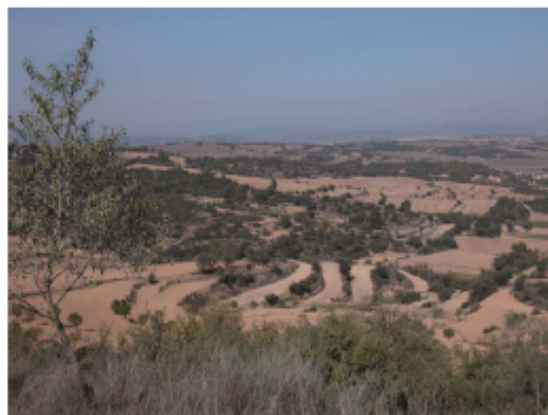
Figura 6.1. Vista des de ca l'Escuder al nord-oest, vora Florejacs (09.10.2006).

El carrascat es troba representat per boscos de petites dimensions a llocs massa costeruts per ser conreats (fig. 6.1) i, en moltes ocasions llur presència s'associa a la garrija ( Quercetum cocciferae ). Les broilles de romani són escasses ( Rosmarino-Ericion ) i els illstonars ( Thero-Brachypodion ), encara que presents, apareixen limitats i restringits als costers d'alguns tossals i turons. Els matollars de siscall i botja pudent ( Salsola-Peganion ) són presents de forma irregular i, en general, ocupen escassa superfície, es troben fragmentats i es restringeixen als marges dels camps de cultiu. Cap al nord i llevant s'aprecia una progressiva presència de les primeres rouredes de roure de fulla petita ( Quercus-wilkommii-Quercetum fagineae ) i pinedes de pinassa ( Pinus nigra subsp. satzmannii ).