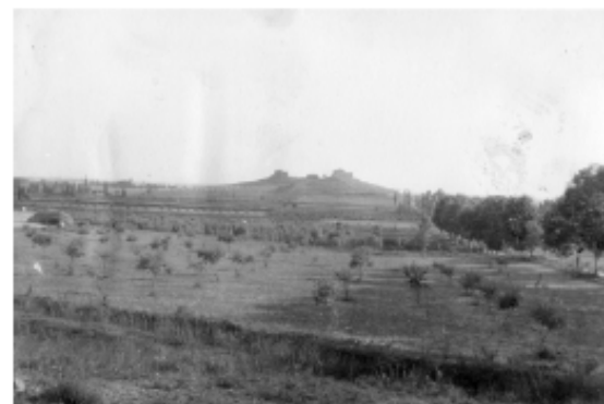
Figura 6.2. Vista antiga de Pulverd d'Agramunt, poble alineat a la vail del riu Sió.

Guissona, per la seva banda, està situada al centre de la plana de homònima. Actualment el casc antic manté l'aspecte medieval, mentre que els nous exemples s'han estès en forma centrífuga i han hagut d'assumir importants transformacions encara actualment en curs. La població actual és de 4.138 habitants i el planejament vigent són les normes subsidiàries del 22/10/1986. Aquestes normes preveuen el desenvolupament de nous creixements residencials i un sòl urbanitzable de 29,32 ha respecte a 102,26 ha de sòl urbà; convé indicar que les reserves de sòl urbanitzable industrial ja s'han esgotat.