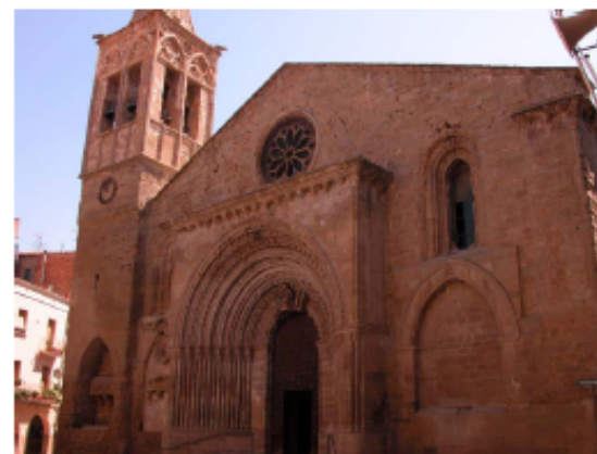
Figura 6.6. Església arxiprestal romànica de Santa Maria d'Agramunt (12.05.2005).

En aquesta unitat cal tenir en compte les processons de la setmana santa d'Agramunt i la processó del Corpus de Concabella.