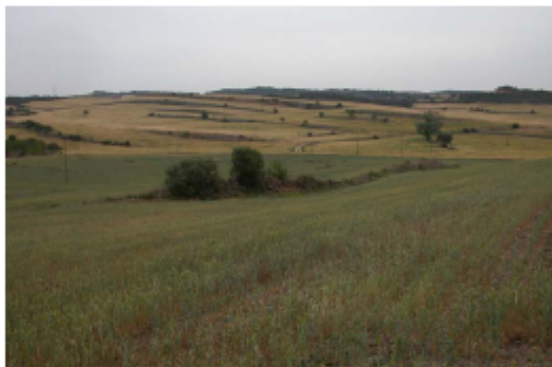
Figura 6.4. Conreus i restes de vegetació natural a l'est de Coscò (30.05.2005)

Aquesta xarxa és determinant quant a accessibilitat per a tota la zona. El major desenvolupament humà de la unitat es dona a la ribera del Sió, columna vertebral d'aquest espai agrícola, que concentra la majoria de les granges. Lluny d'aquest eix, el domini agrícola és absolut, ondulat, vermellós i puntejat per peus llenyosos alliatats baixos.