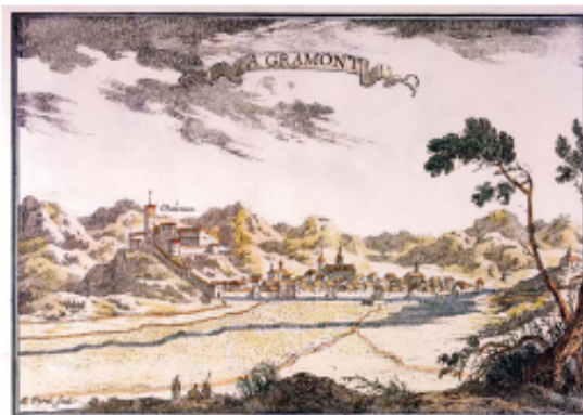
Figura 6.5. Gravet d'A. Perel (segle XVIII), on idealitza el nucli antic d'Agramunt. L'obra que forma part del fons pictòric de la Diputació de Lleida.

A. Perel és un gravador (i probablement també dibuixant) francès, el conjunt de l'obra del qual se situa al segle XVIII. Entre les seves litografies, es compta amb "Agramont", la qual mostra el nucli antic d'Agramunt (fig. 6.5).