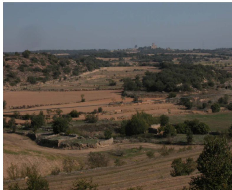
Panoràmica des de Florejacs. S'observa el castell de Sitges. Imatge presa el mes d'octubre de 2005.