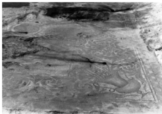
Figura 6.3. Mosaic romà descobert a Agramunt, procedent d'una vil·la senyorial. Imatge anònima de 1952, cedida pel Servei d'Audiovisuals de la Fundació Pública de l'Institut d'Estudis Ilerdencs de la Diputació de Lleida.

La presència sarraïna durant els segles VIII i IX ens ha llegat algunes obres en forma de sèquies de regadiu i pelxeres que permetien conreus d'horta a la ribera del Sió. Més endavant, les terres d'aquesta unitat foren un lloc de marca, de frontera entre àrabs i cristians.