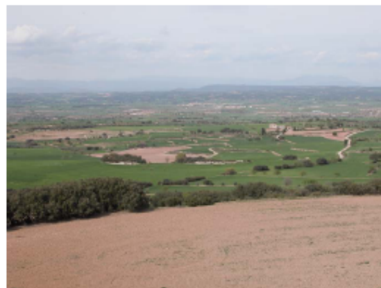
Figura 6.8. Conreus i paisatge de l'Alt Sió amb els primers estrets propinques al fons. Panoràmica des del Pilar d'Aimenara, cap al nord (03.04.2006).

De tota manera, el paisatge agrari característic no són pas aquests patrons originals, sinó conreus de secà en suaus aterraments (fig. 6.7).